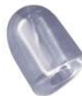
17 gr HOLLOW ICE CUBE