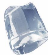
18 gr FULL ICE CUBE