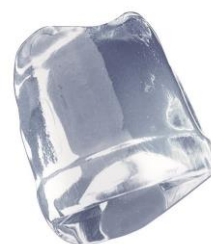
18 gr. FULL ICE CUBE

UNDERCOUNTER: Dispositivos "universal" de tamaño medio, que se puede instalar también en el mobiliario con depósito estándar hasta L60 x W70 x H85 cm. Ideal para restaurantes, varias zonas de bar de los clubes, las ceremonias de tipo buffet y fiestas. Recipiente con capacidad superior con el fin de disponer de grandes cantidades de hielo. Todos los modelos están tropicalizados: se puede instalar hasta una temperatura de 43°C y con una temperatura del agua de 32°C.