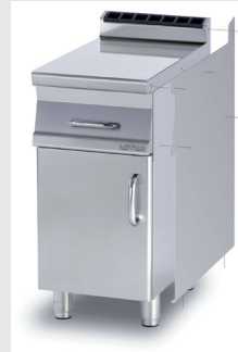
Testata 1 lato, serie 90, destra Head 1 side, 90 series, right Abschluss Element 1 Seite, 90 Serie, rechts Element de jonction 1 côté, série 90, droit Embellecedor 1 lado, serie 90, derecho