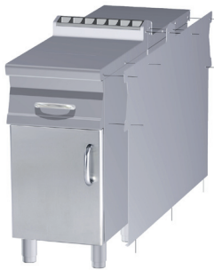
Testata 2 lati, serie 70, destra Head 2 sides, 70 series, right Abschluss Element 2 Seiten, 70 Serie, rechts Element de jonction 2 côtés, série 70, droit Embellecedor 2 lados, serie 70, derecho