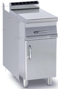
Testata 1 lato, serie 90, sinistra Head 1 side, 90 series, left Abschluss Element 1 Seite, 90 Serie, links Element de jonction 1 côté, série 90, gauche Embellecedor 1 lado, serie 90, izquierdo