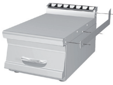
Testata chiusura Head end filler strip Abschluss-Element Elément de jonction Chapa de cierre